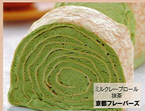
ミルクレープロール 抹茶 京都フレーバーズ