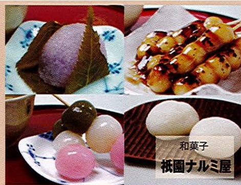
和菓子 祇園ナルミ屋