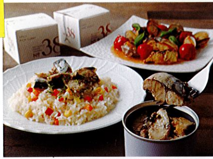
3,780円 三種の厳選胡椒立で・辛味引き立つガーリックオイル 仕立て 各190g、スパイス香る芳醇カレー仕立て185g